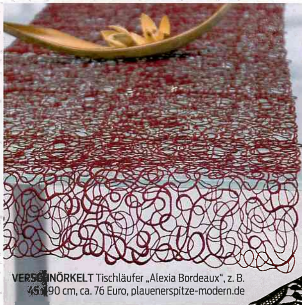
VERSCHÖNÖRKELT Tischläufer „Alexia Bordeaux“, z. B. 45 x 190 cm, ca. 76 Euro, plauenerspitze-modern.de