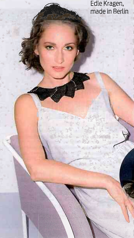
Edle Kragen, made in Berlin

Kooperation mit türkischen Frauen aus verschiedenen Berliner Stadtteilen, die über besondere handwerkliche Fähigkeiten verfügen, werden die Entwürfe in Heimarbeit produziert. Der Fokus liegt auf dem interkulturellen Austausch und den zwischenmenschlichen Werten in einer immer schneller werdenden Welt. Einmal die Woche trifft man sich zum deutsch-türkischen „Häkelsalon“, klappert mit den Nadeln und verbessert beim Plaudern das Deutsch. Infos: ritainpalma.com